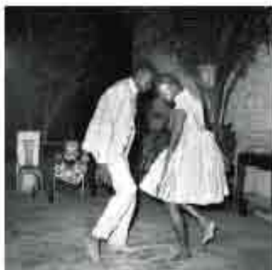
Malick Sidibé, Man et Femme , 1963, gelatin silver print signed in 2011, 120 x 120 cm / 47,2 x 47,2 inches

PARIS PHOTO LOS ANGELES PARAMOUNT PICTURES STUDIOS APRIL 25 - 28 2013