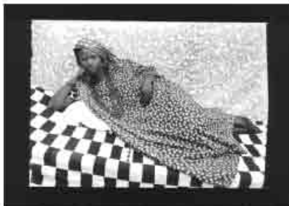
Seydou Keita, 1956-1957, gelatin silver print signed in 1986, 120 x 100 cm / 47,2 x 70,8 inches