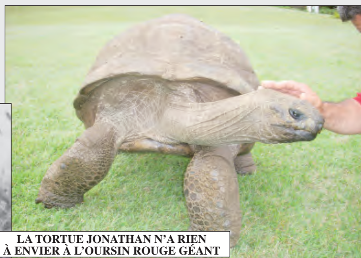
LA TORTUE JONATHAN N'A RIEN À ENVIER À L'OURSIN ROUGE GÉANT

espèces de tortues géantes peuvent vivre plusieurs centaines d'années. La tortue la plus vieille serait Adwaita, décédée en mars 2006, une tortue géante des Seychelles vivant en Inde. Aujourd'hui, les plus âgées sont Jonathan, 182 ans, et Esmeralda, 170 ans.