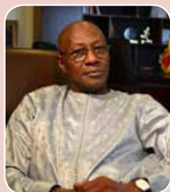
M. Abdoulaye Diop, Ministre de la Culture et de la Communication.

L'Etat du Sénégal, qui a initié et porté la Biennale depuis sa création en 1989, d'abord pour les arts et les lettres, s'est toujours évertué à en assurer la pérennité, tout en veillant à ce que son attractivité, rendue possible par la qualité de ses expositions, de son programme et de ses thématiques, puisse se renforcer d'édition en édition.